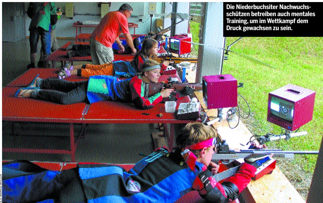
Die Niederbuchsiter Nachwuchsschützen betreiben auch mentales Training, um im Wettkampf dem Druck gewachsen zu sein.

Das Oltner Tagblatt beleuchtet die Nachwuchsarbeit in den regionalen Sportvereinen. Schon vorgestellte Abteilungen finden Sie unter www.oltner.tagblatt.ch